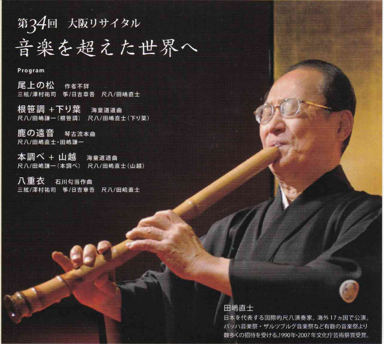
田嶋直士 日本を代表する国際的尺八演奏家。海外17カ国で公演。バッハ音楽祭・ザルツブルグ音楽祭など有数の音楽祭より数多くの招待を受ける。1990年・2007年文化庁芸術祭賞受賞。